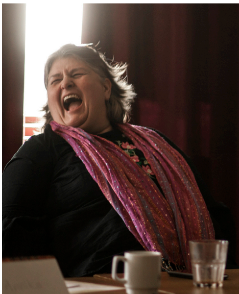
Vi uppmanades jämt och ständigt, om att- "Ha roligt"